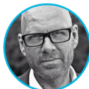
Robert Graham Funktion Projektering Skanska Sverige